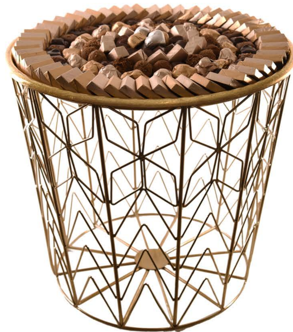
TABLE BASSE EN METAL ET PLATEAU OR