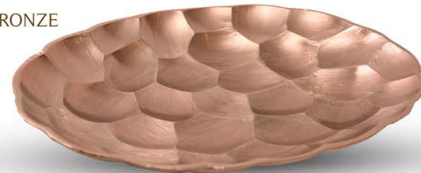
ASSIETTE OVALE BRONZE