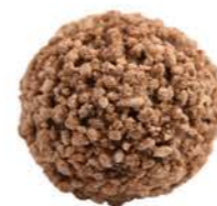
BOMBE PRALINE NOISETTE