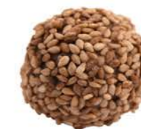
BOMBE PRALINE SESAME