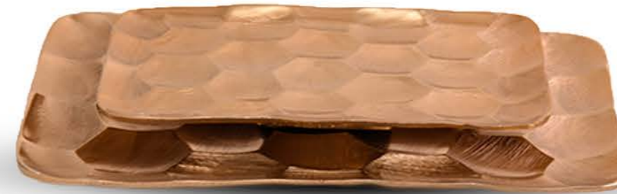
PLATEAU RECTANGLE SUR PIED