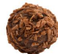
BOMBE PRALINE COCO