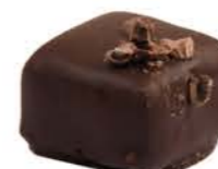
NOIR AMER 77%