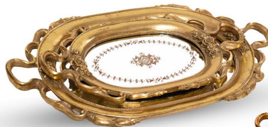
PLATEAU EN BOIS OR