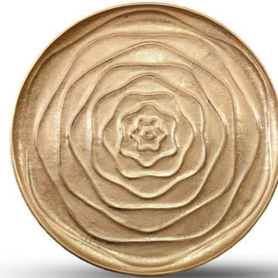
CENTRE DE TABLE