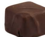
PRALINE NOIR FEUILLE