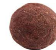
BOMBE GANACHE FRAMBOISE