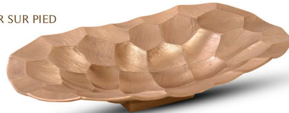
COUPE OVALE OR SUR PIED