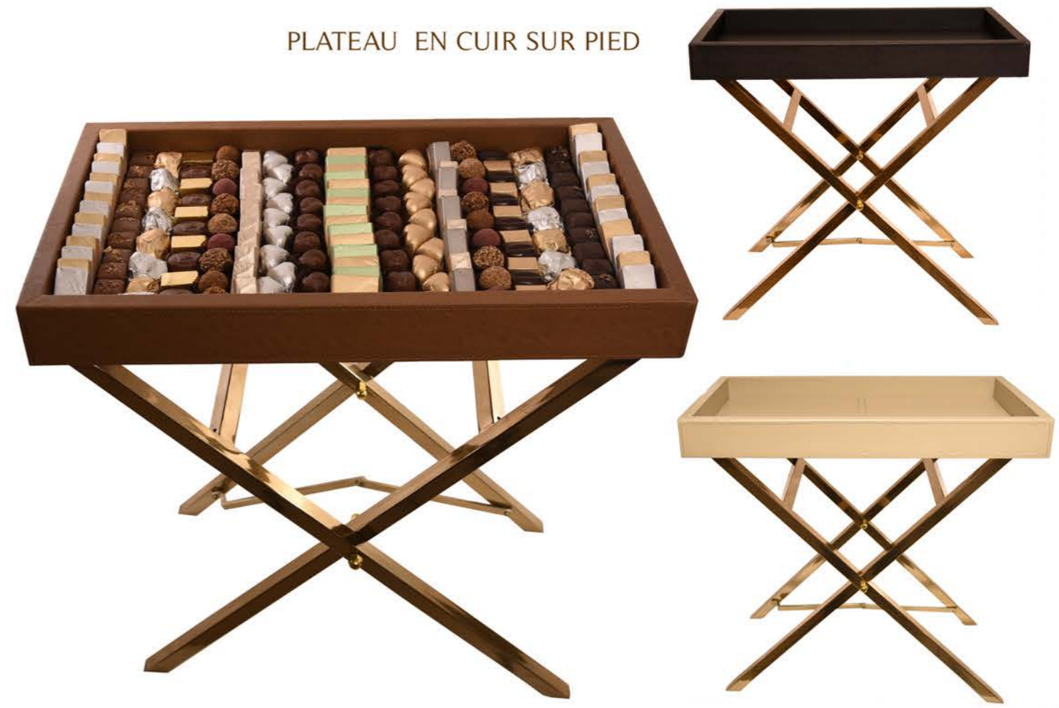
PLATEAU EN CUIR SUR PIED

• NEW YORK 53X30X55Cm - 2,5 Kg - 3600 DH TTC