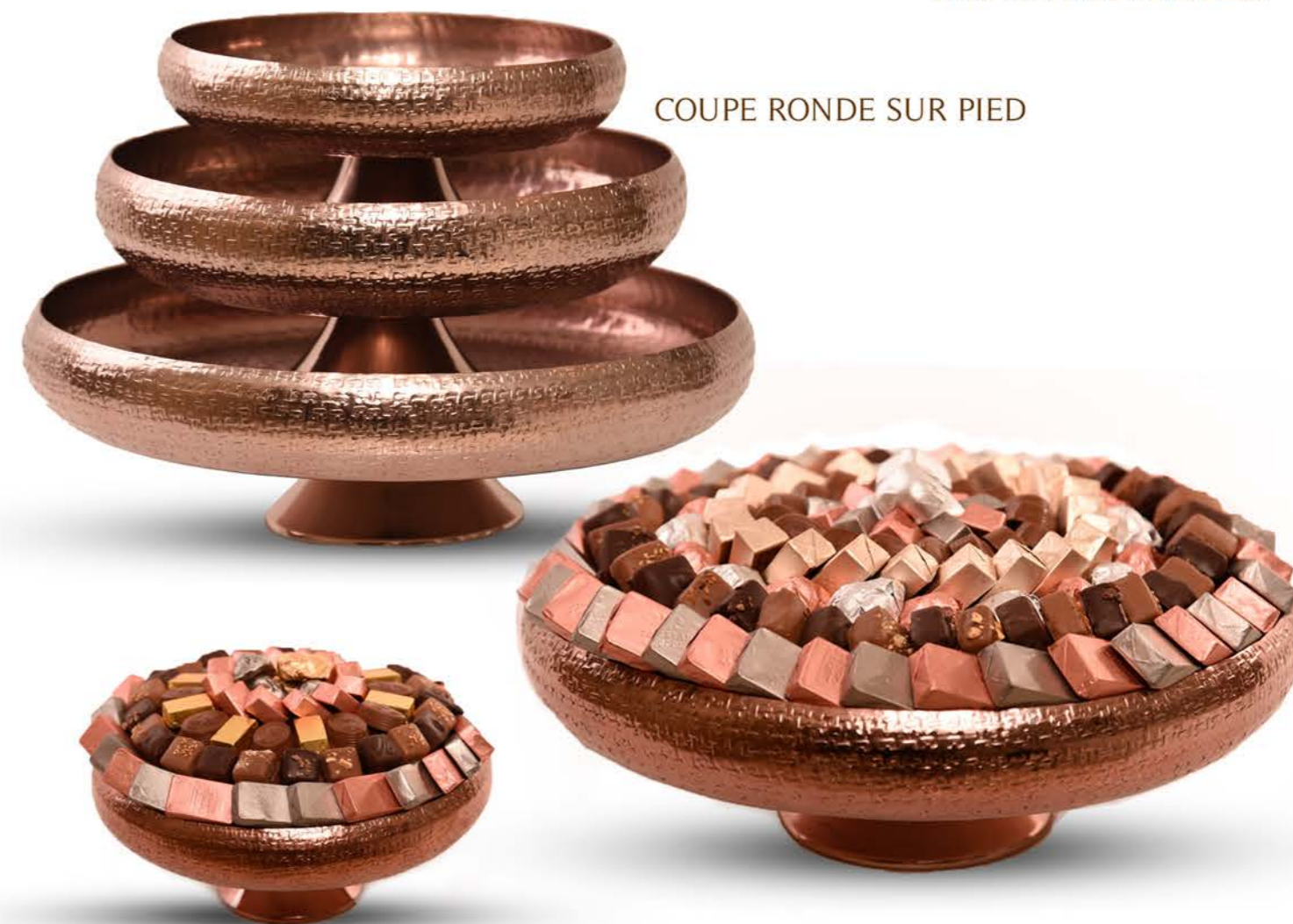
COUPE RONDE SUR PIED